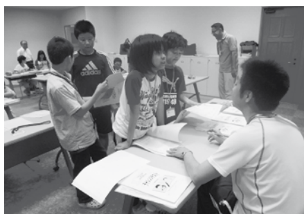
1日の終わりの夜学習