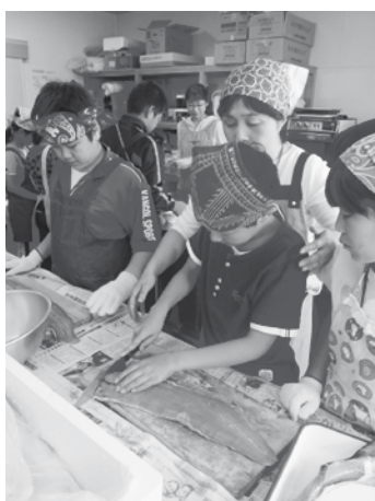
標津漁協女性部によるサケのさばき方の指導