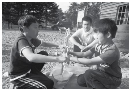
悪戦苦闘した火おこし体験