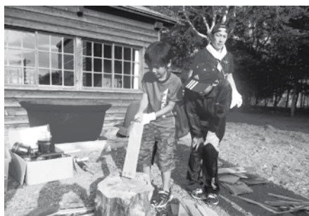
うまくできたまき割り体験