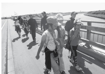
ポー川までハイキング