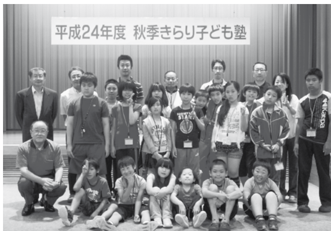
参加した18人の子どもたちとスタッフの皆さん

毎日の学習では、根室教育局が子どもたち一人ひとりに分かりやすくていねいに指導。また、最終日には、保護者への親子で楽しめるコミュニケーションづくりの研修会も行われ、盛りだくさんの内容の3日間となりました。