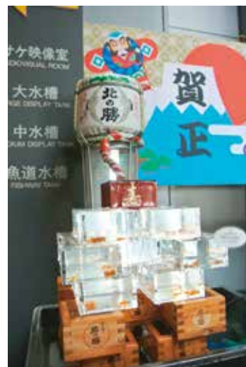
酒升によるサケの卵展示