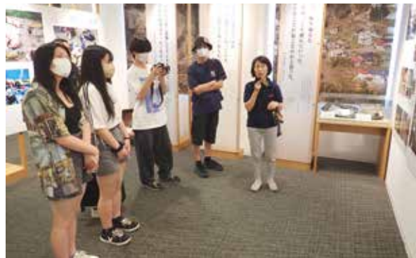
▲語り部の関さんから当時の状況を聞く様子

づかされました。研修先で出てきた「自助」・「共助」・「公助」の3つのキーワードのうち、「共助」がこれに当たると思います。山古志村でも、地域によって救助(公助)が遅れたということでした。まずは、自分の身を守り、備える「自助」、そしてご近所同士助け合う「共助」が必要不可欠であることがわかりました。この文章を読んで、少しでも「自助」(備え)の行動を始めてくれたら嬉しいです。