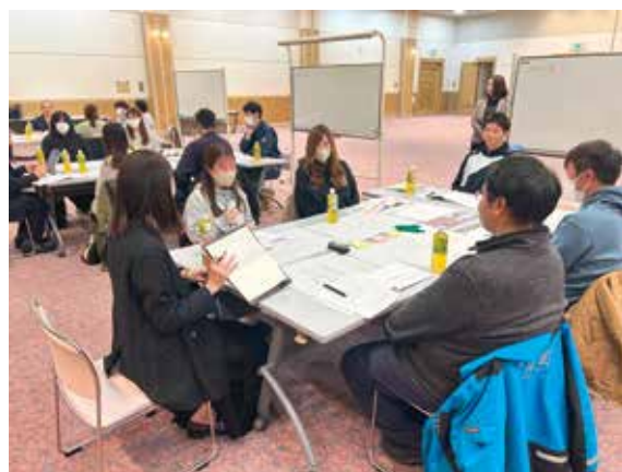
第1回しべつみらいワーキンググループの様子

今後も定期的に意見交換会の実施を予定しており、町民メンバーによる継続した議論を行うとともに、基本計画・基本構想の検討に反映していきます。